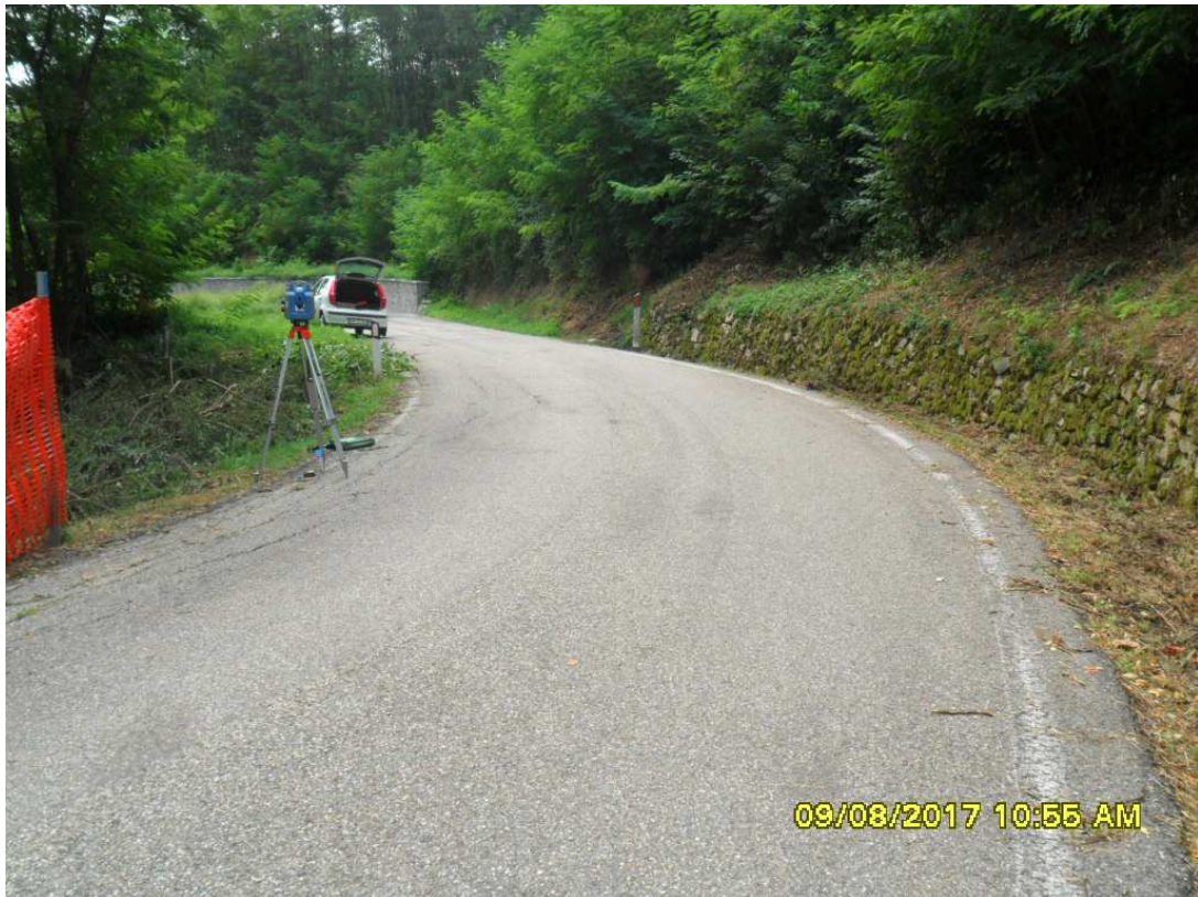
Foto 8: particolare fine fosso di monte (punto di ripresa dir. Casapinta)