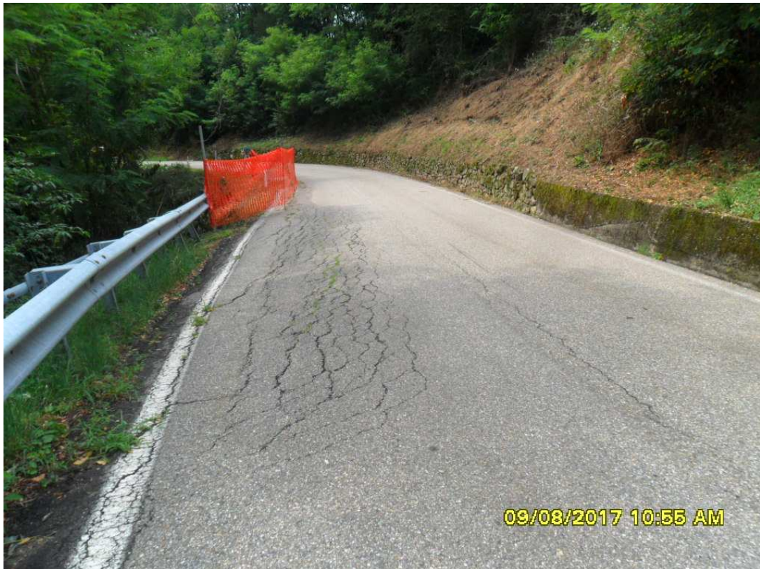
Foto 6: particolare fine cunetta inizio fosso di monte (punto di ripresa dir. Casapinta)