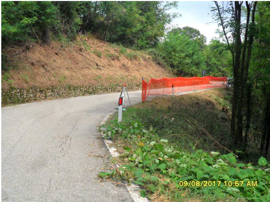
Foto 12: particolare intervento eseguito in seguito ad evento alluvionale 2014 al km 2+800 (punto di ripresa dir. Trivero)