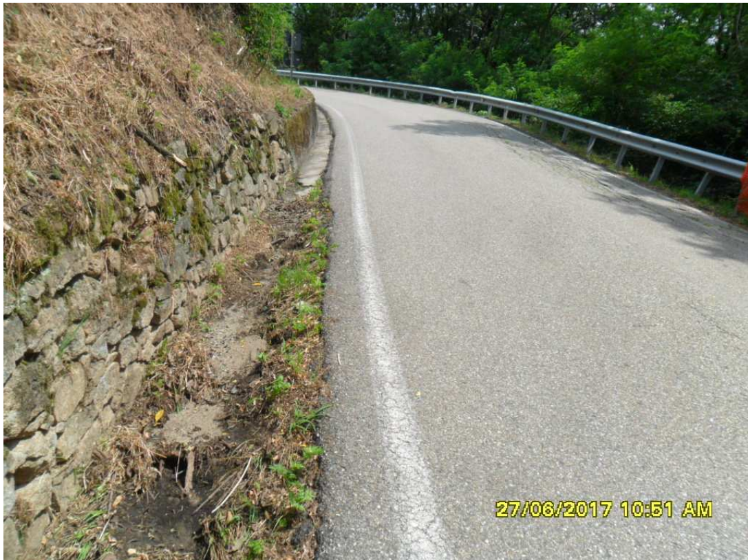
Foto 10: particolare fosso di monte (punto di ripresa dir. Casapinta)